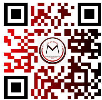
Bekijk hier het YouTube-filmpje!